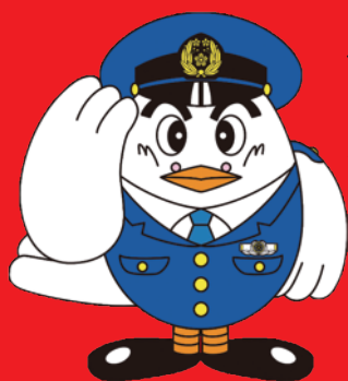
埼玉県警察マスコット ポツポくん