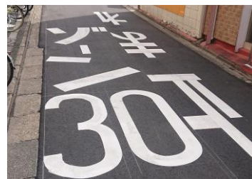
最高時速30キロ規制の道路も多くあります。

川越市内の街歩きの観光を予定している方は、 ・横断歩道が近くがあれば横断歩道を利用する ・信号をしっかりと守り、点滅したら横断しない など、基本的な交通ルールをしっかりと守り、交通事故に遭わないように注意をお願いします。