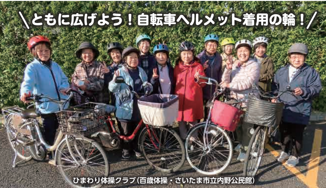
ひまわり体操クラブ(百歳体操・さいたま市立内野公民館)