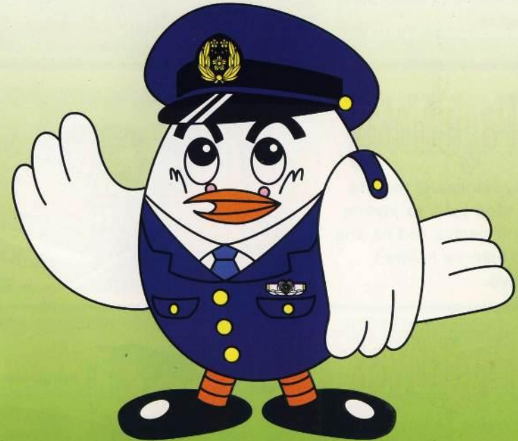
"Poppo-Kun" Mascot ng Saitama Police

Paghinto • Pagtingin • Paghintay • Pagtitiyak