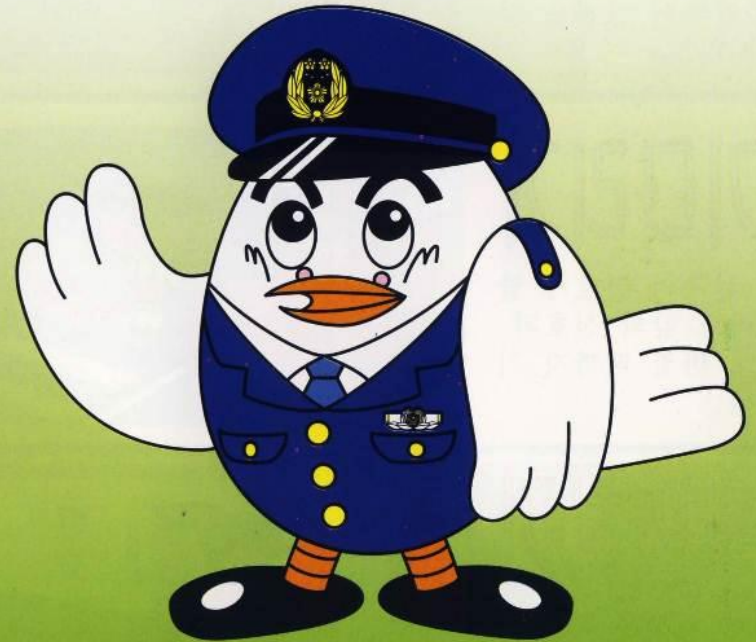
사이타마현경찰 마스코트 포포