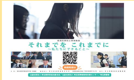
掲示していただいたリーフレット