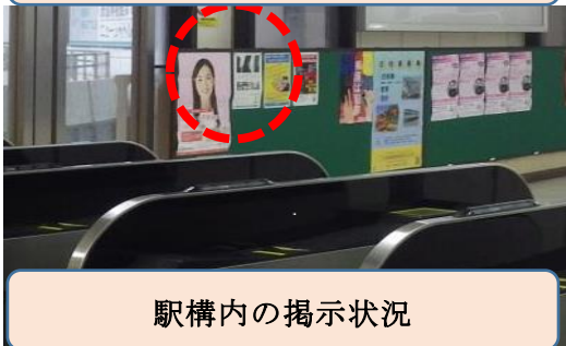
駅構内の掲示状況