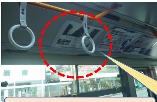
バス車内の掲示状況

令和5年6月1日から15日までの間に実施した痴漢犯罪防止キャンペーンにおいては、県内各駅での啓発活動など、協議会会員の皆様にご協力いただき、ありがとうございました。期間中各所で実施したポスターの掲示及び大型ビジョンの放映について紹介します。