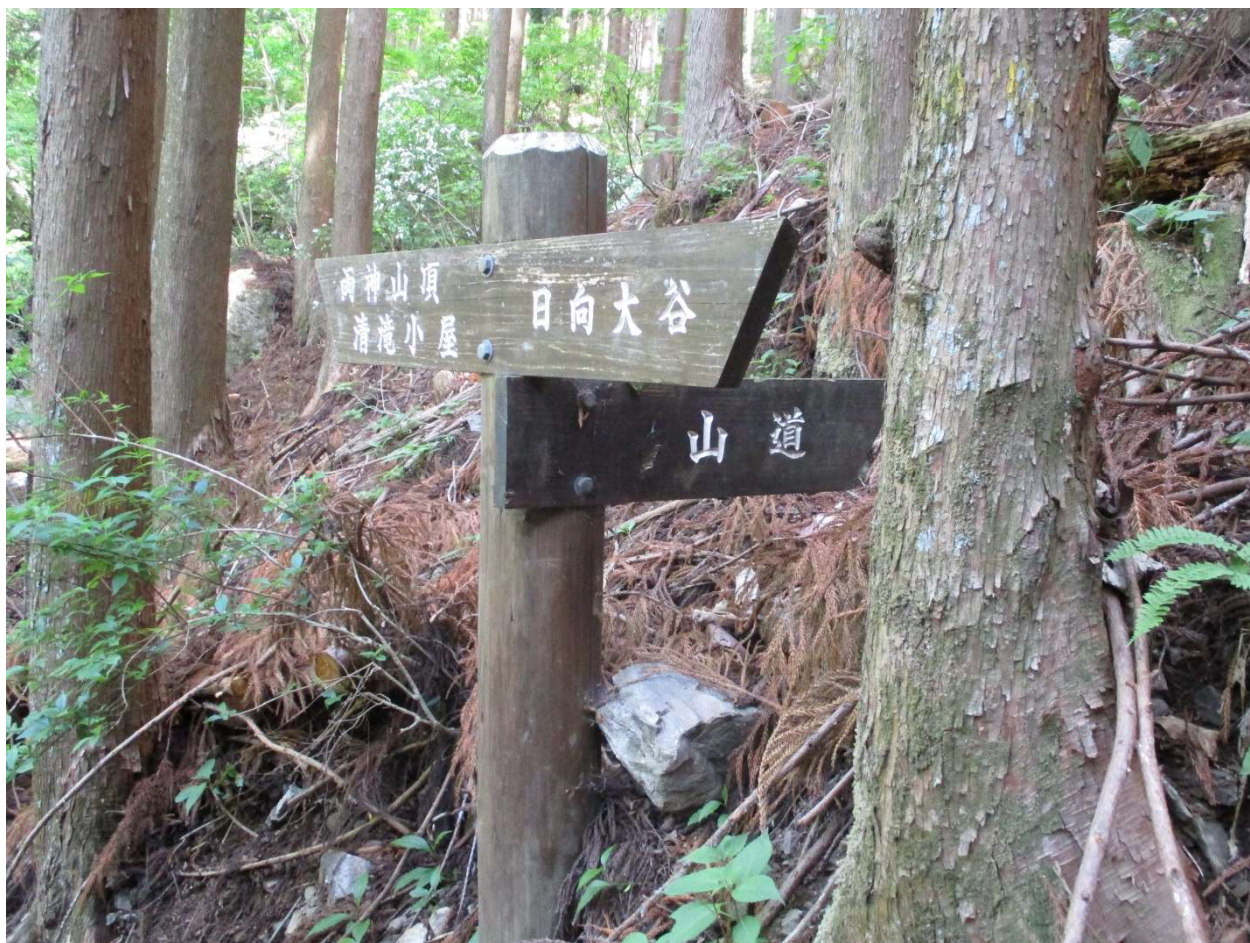
「山道」と書かれた方向には進行しない