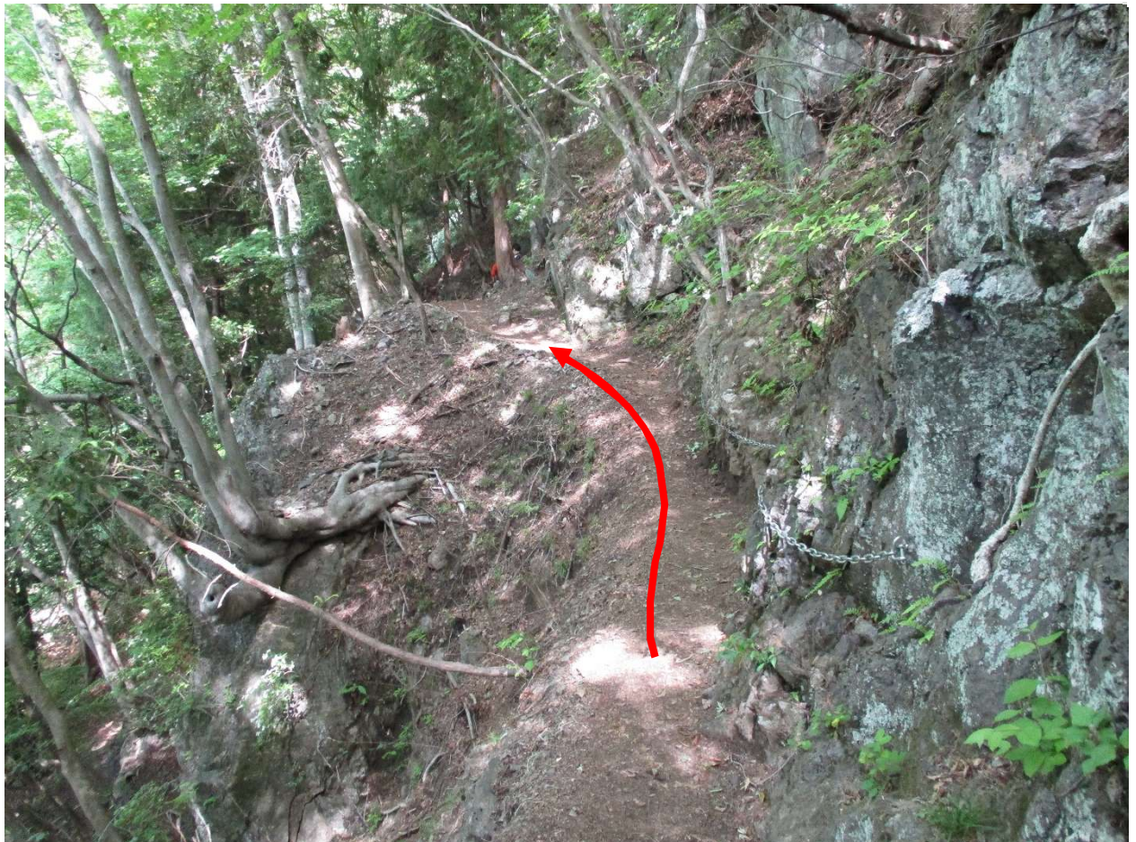
鎖場、登山道が狭まっているので左側の急斜面に注意