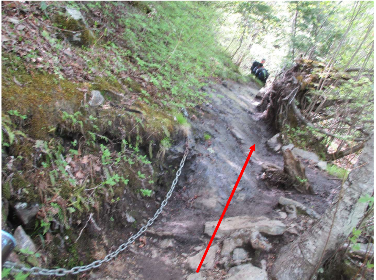
鎖場の通過は、ストックを収納して手に何も持たない