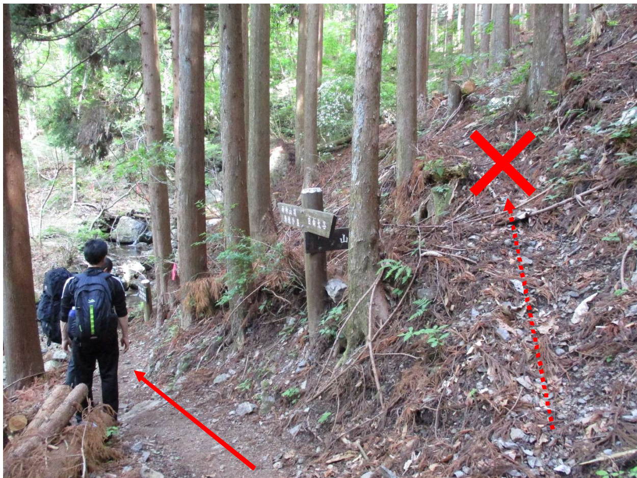
「山道」と書かれた方向には進行しない ※道は無い※