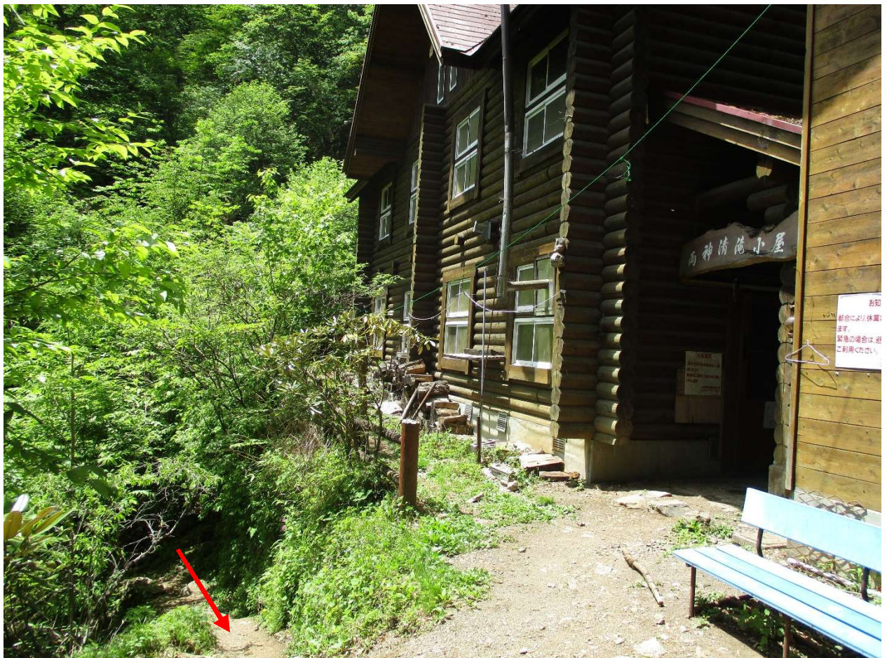
清滝小屋（ログハウス）