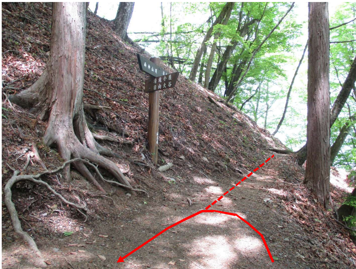
七滝沢コースとの合流地点、下山時、分岐に気付かずに直進しないように注意