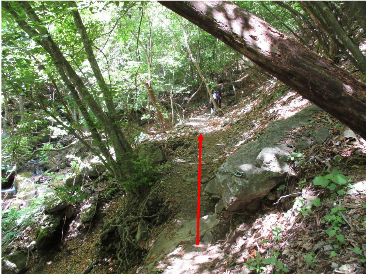
沢を左側に見ながら進む