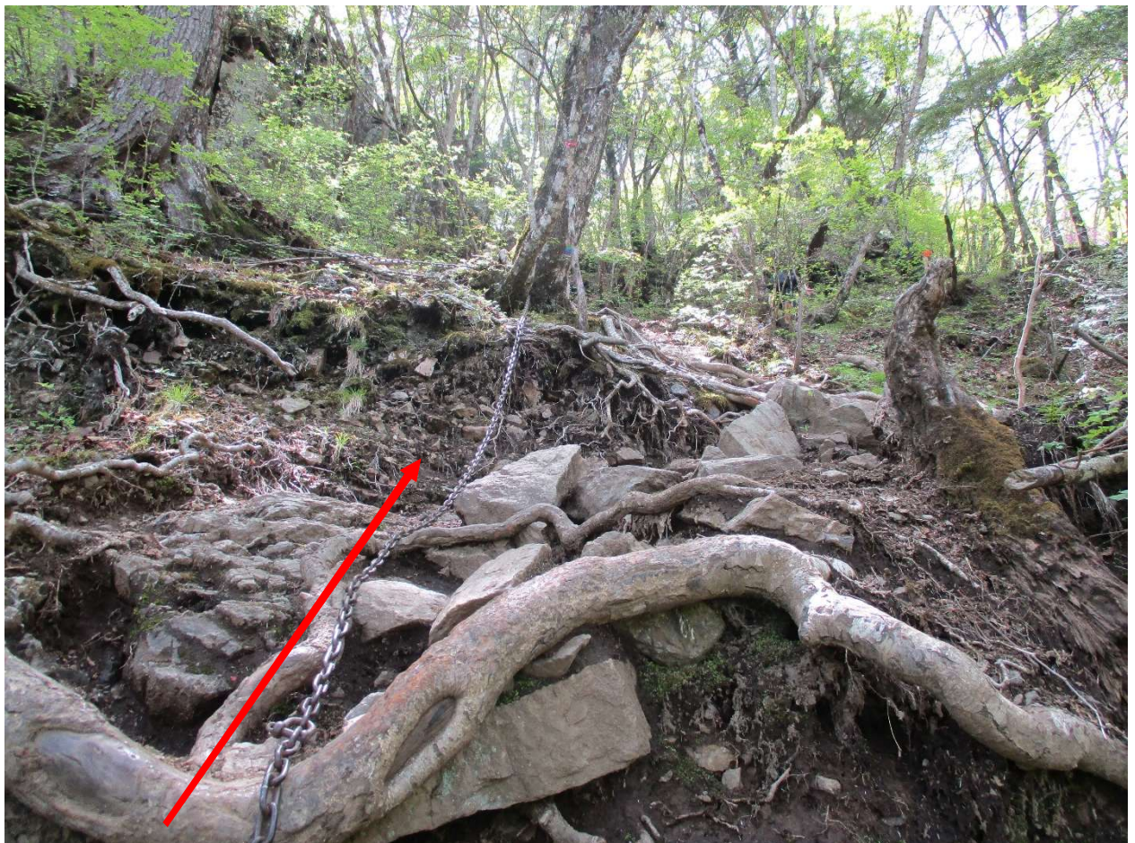
上からの落石に気を付ける、下にも石を落とさない