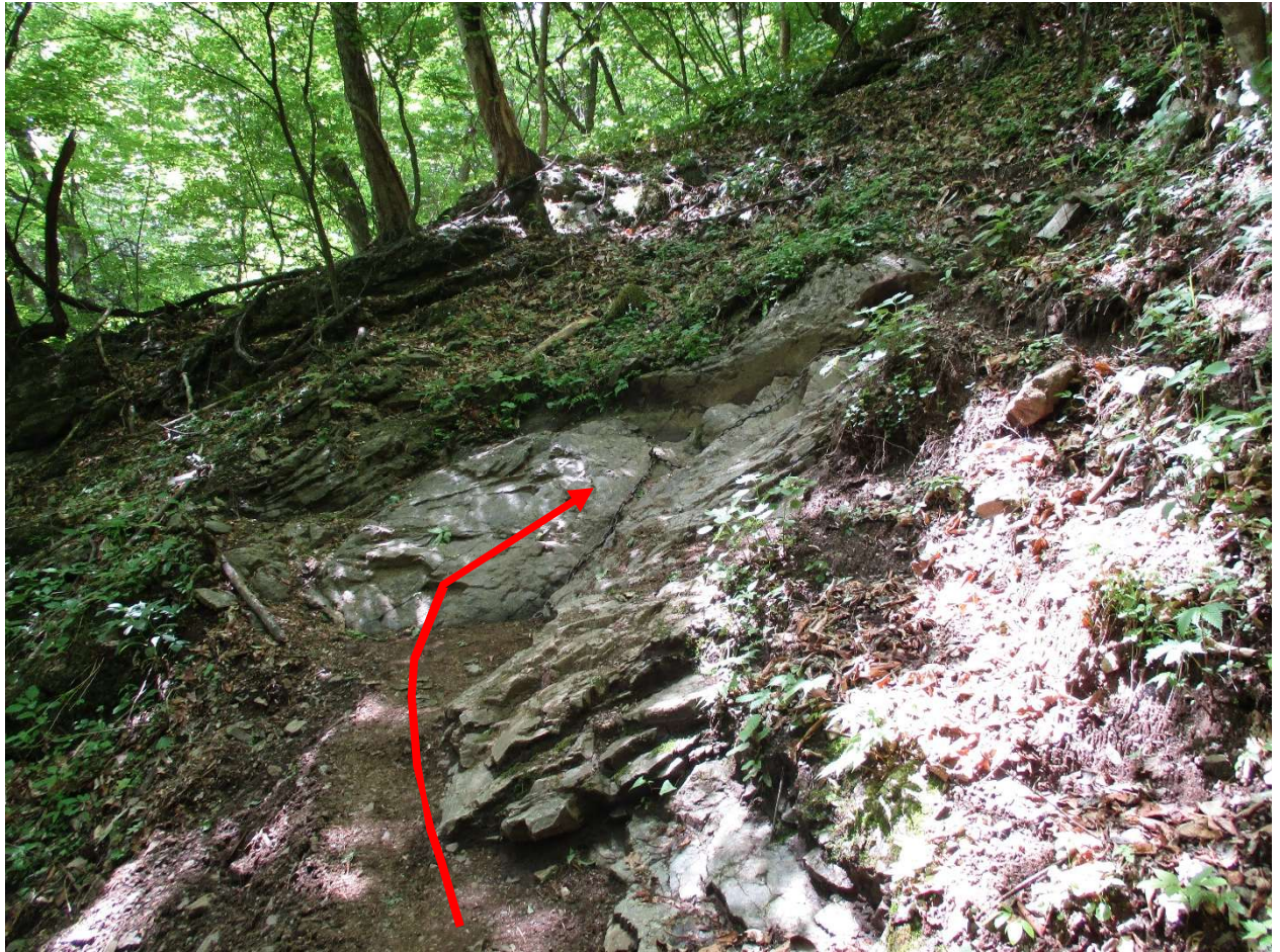
ちょっとした岩場に鎖あり