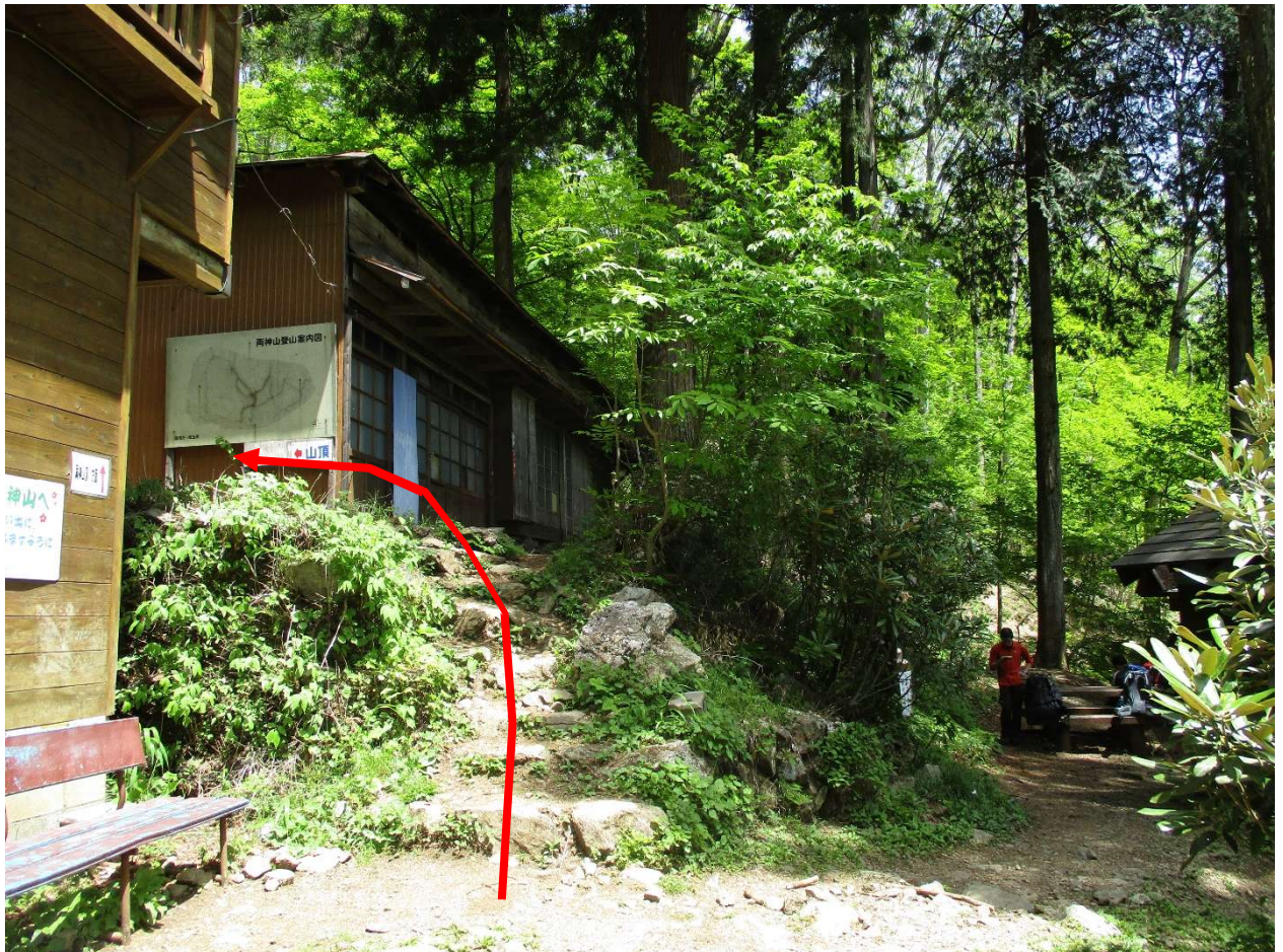
清滝小屋から上は、つづら折りの登山道