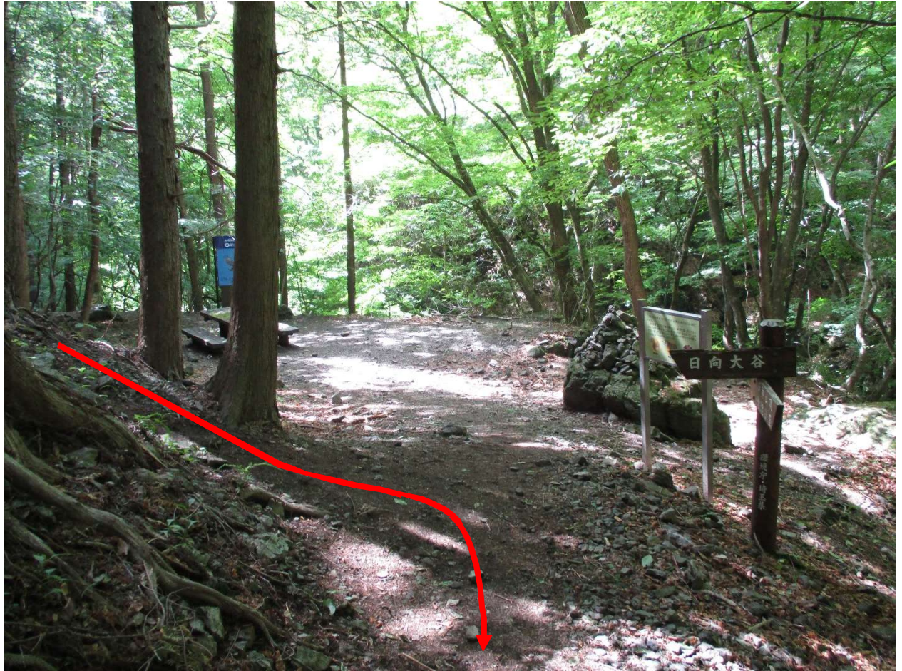
会所にはテーブルとベンチがある