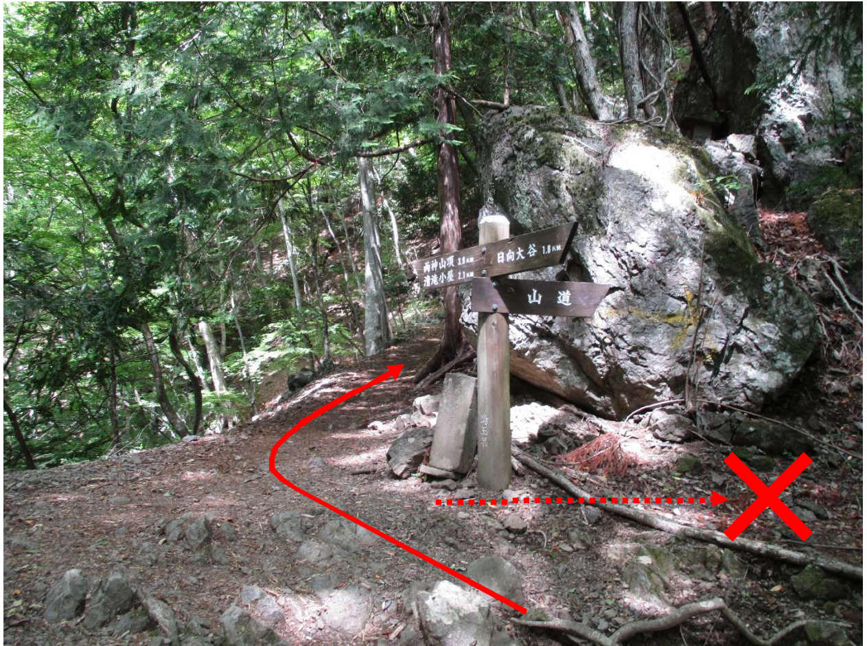
「山道」と書かれた方向には進行しない ※道は無い※