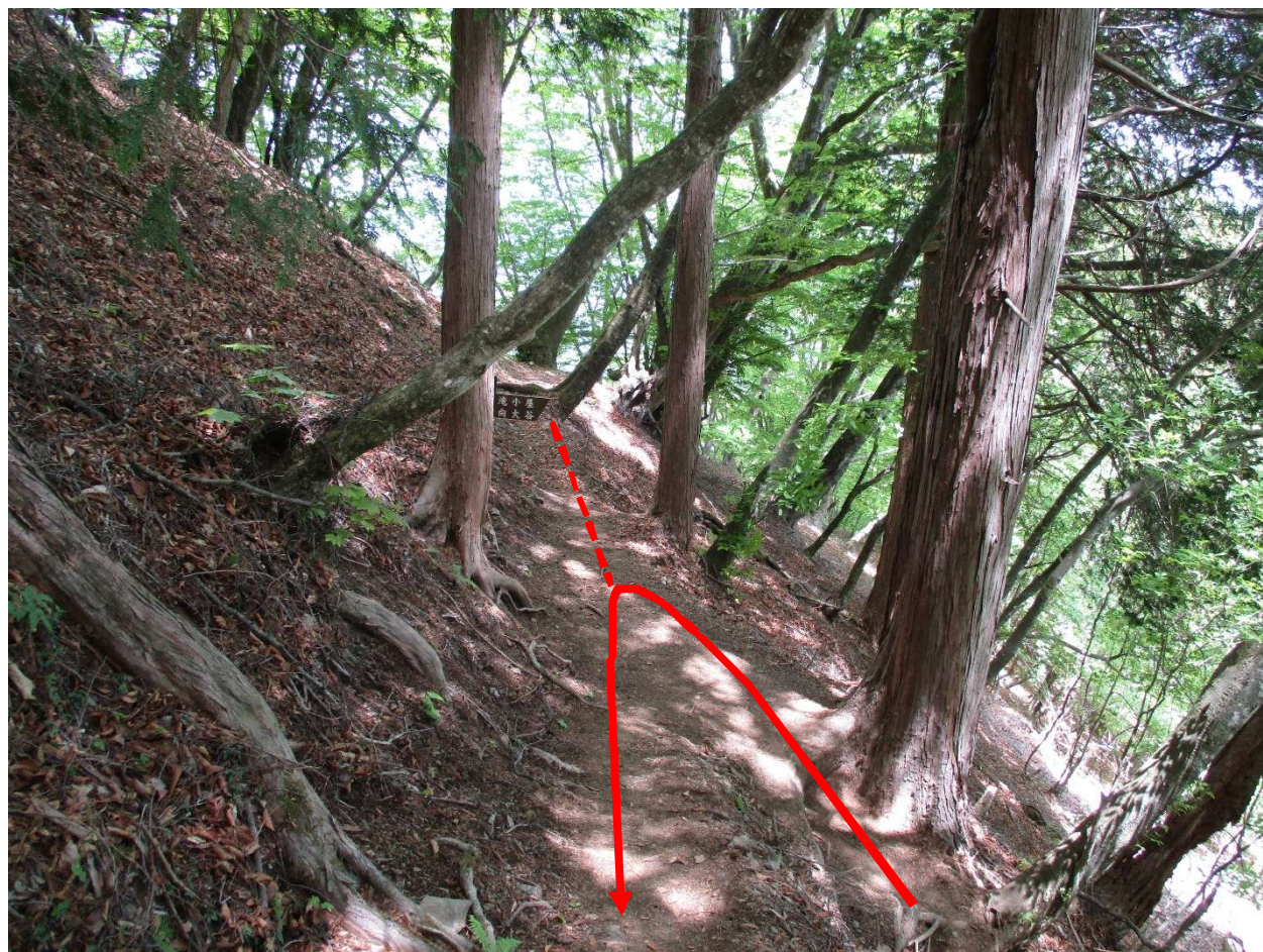
七滝沢コースとの合流地点、下山時、分岐に気付かずに直進しないように注意