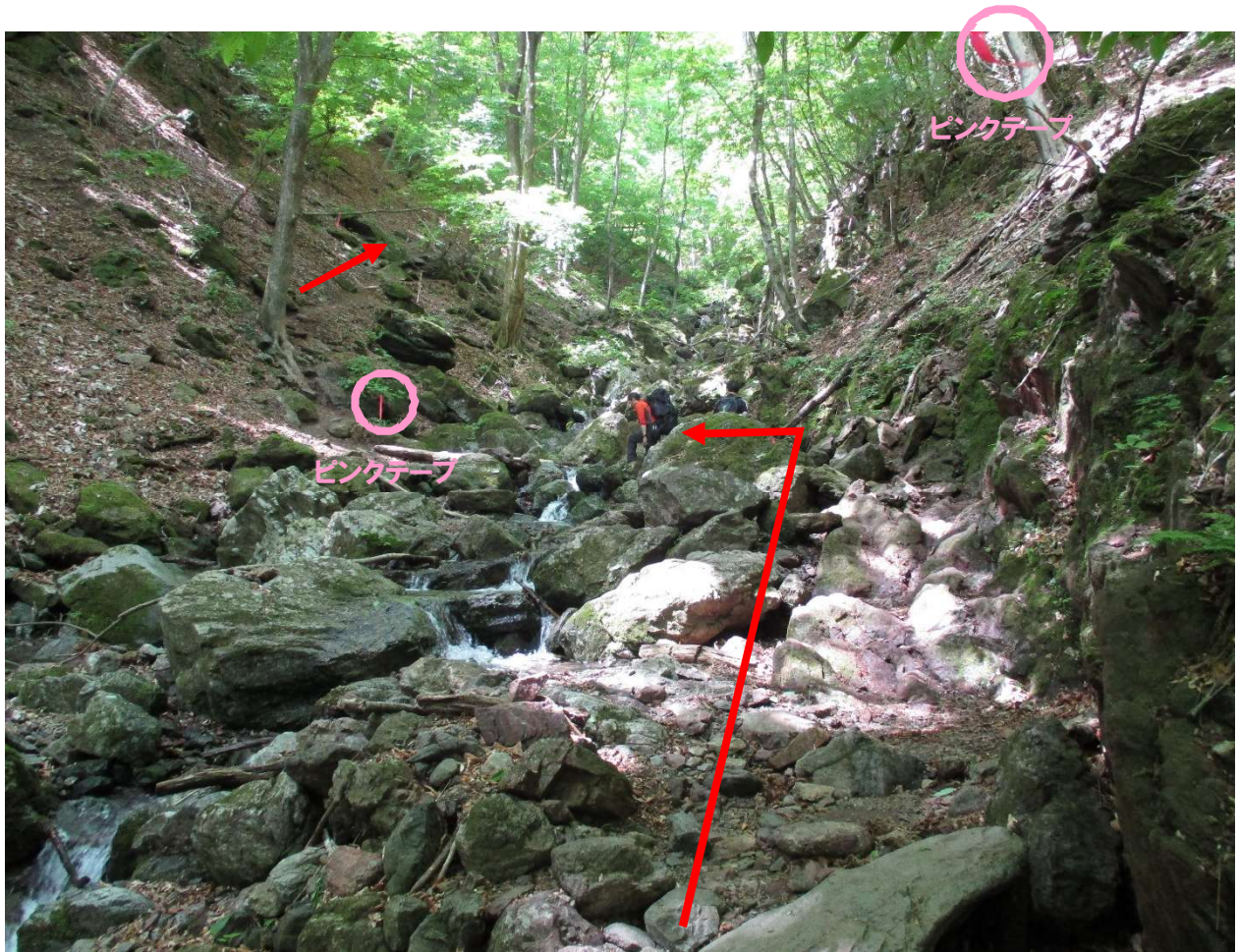
沢を対岸（右岸側）に渡る