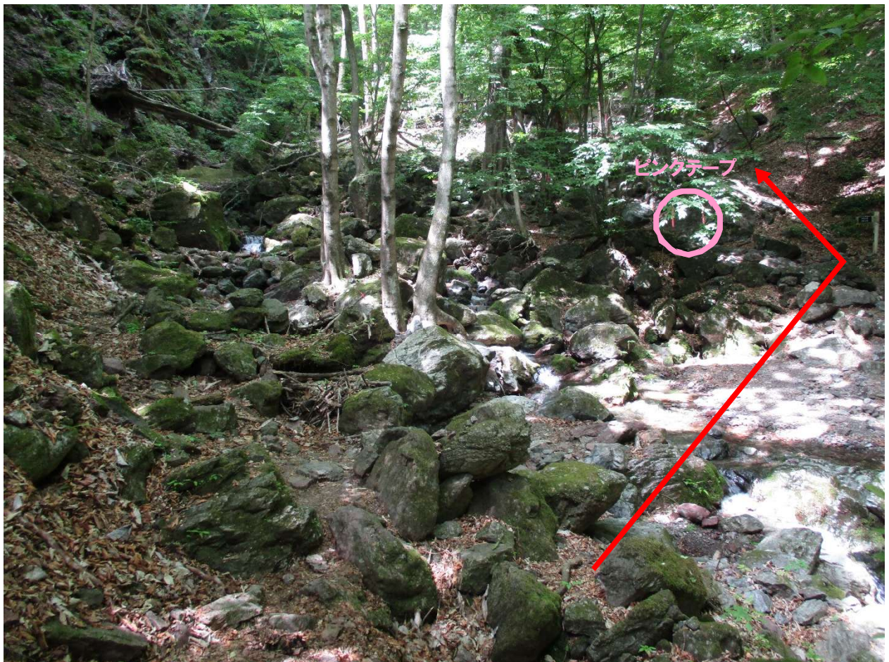
沢を対岸（左岸側）に渡る