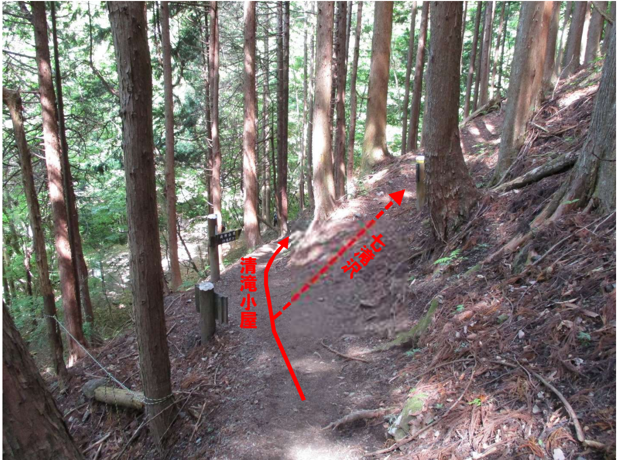
会所を目前にして、登山道が分岐する