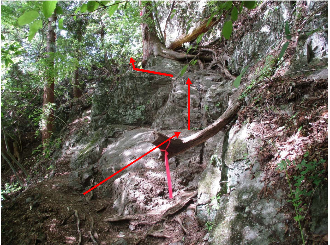
最初の鎖場、3点支持（常に手足の3点で岩を確保している状態）を意識して通過は慎重に