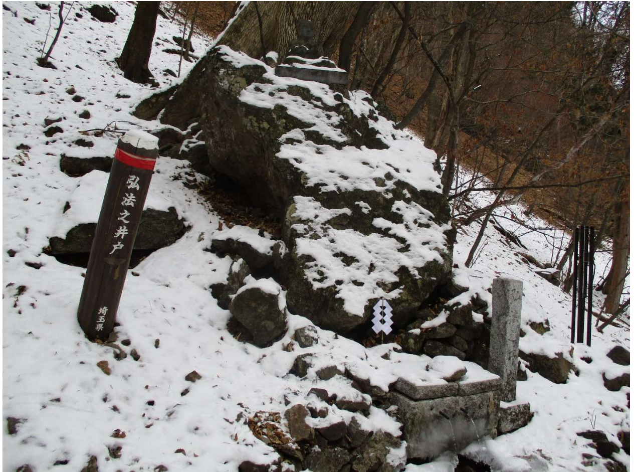
冬場、弘法之井戸から登山道に流れ出した水が凍結するため転倒に注意 写真は冬に撮影