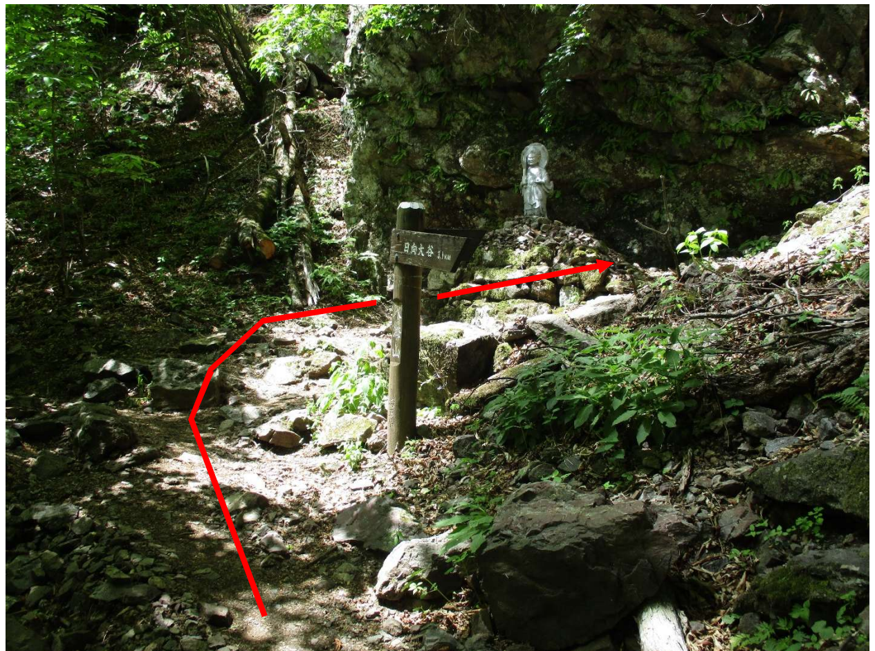
八海山の先から登りがきつくなる