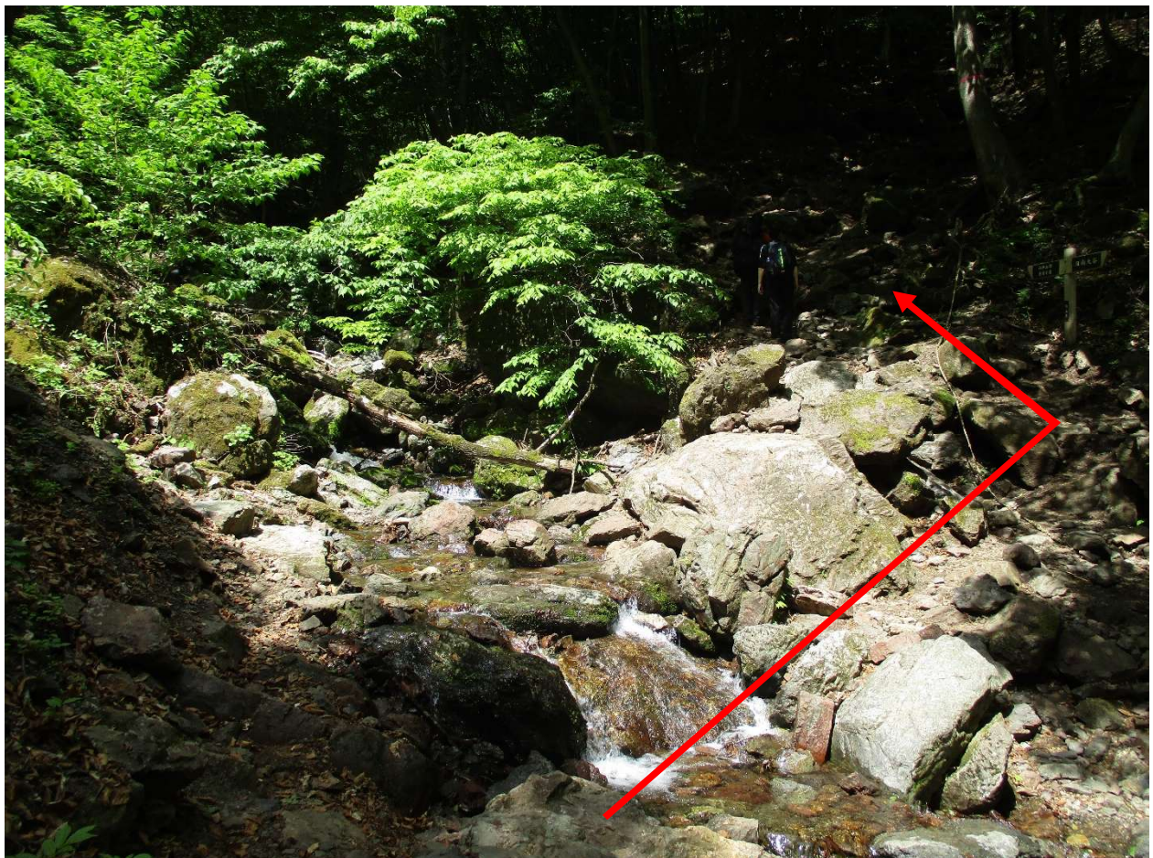
沢を対岸（左岸側）に渡る