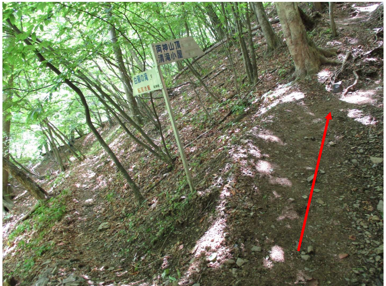
清滝小屋までもうひと踏ん張り