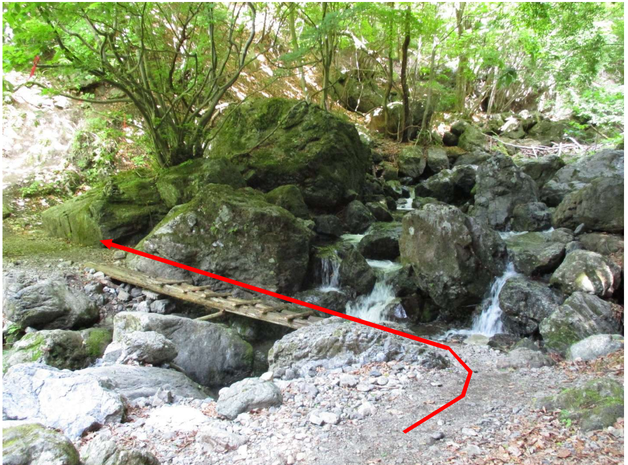
会所から沢沿いを少し歩き、七滝沢を対岸に渡る