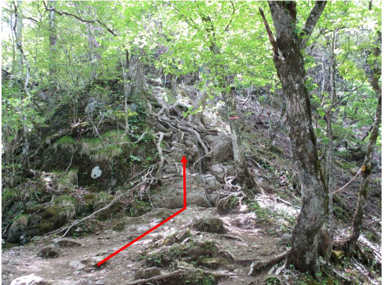
鎖場の連続、3点支持（手足3点が岩を確保している状態）を意識して通過は慎重に