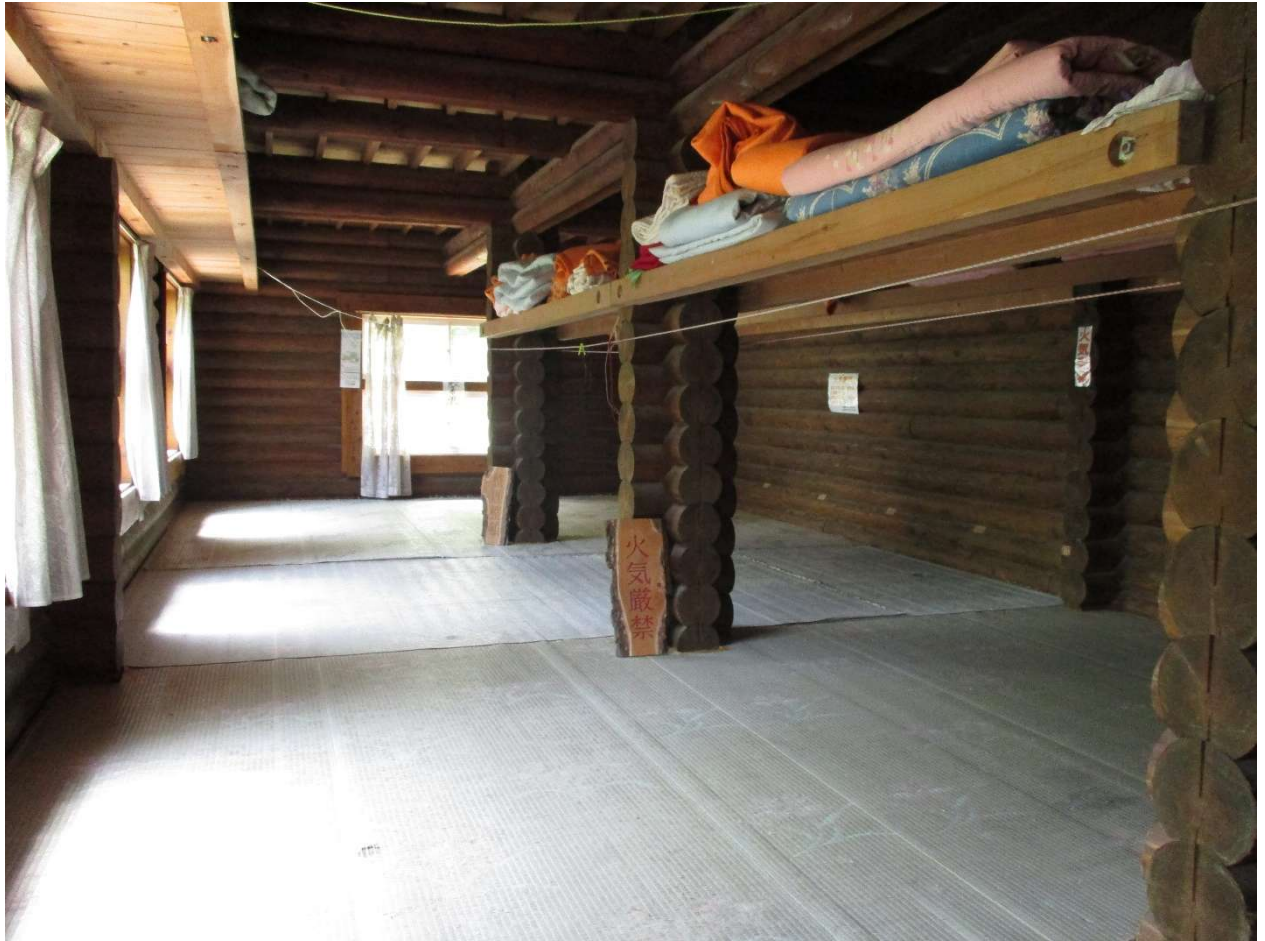
小屋の様子、使用後は掃除を忘れずに